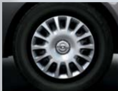
Jante din oțel incl. capac, 5,5 J x 14, design cu 14 spițe, pneuri 185/70 R 14