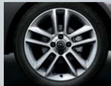
Jante din aliaj, 7 J x 17, design cu 5 spițe duble, pneuri 215/45 R 17