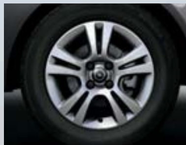
Jante din aliaj, 6 J x 15, design cu 5 spițe duble, pneuri 185/65 R 15